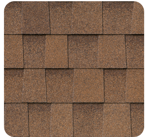
Desert Shake IR