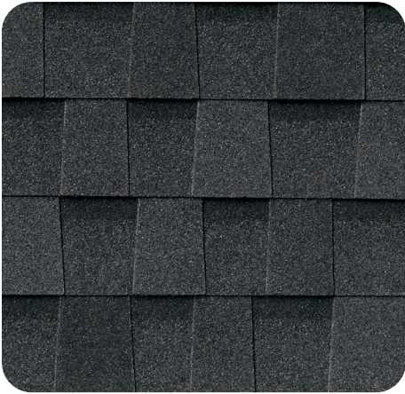
Black Shadow IR