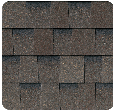
Weathered Wood IR