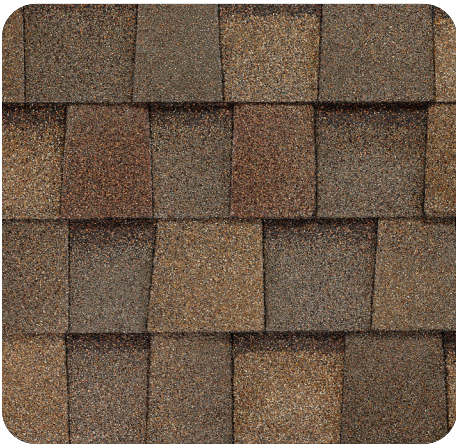
Cool Coral Canyon