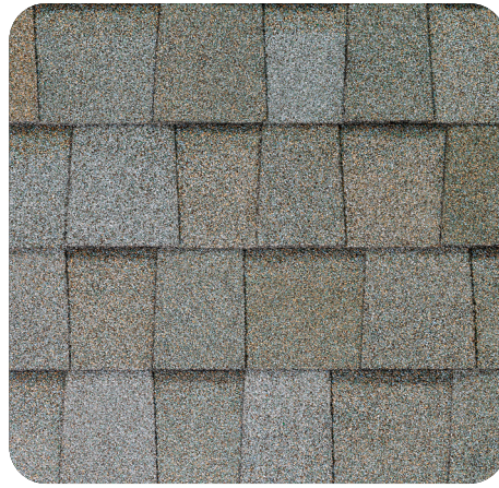
Cool Moonlight Beach