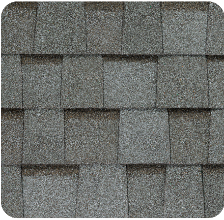
Cool Coastal Cliffs